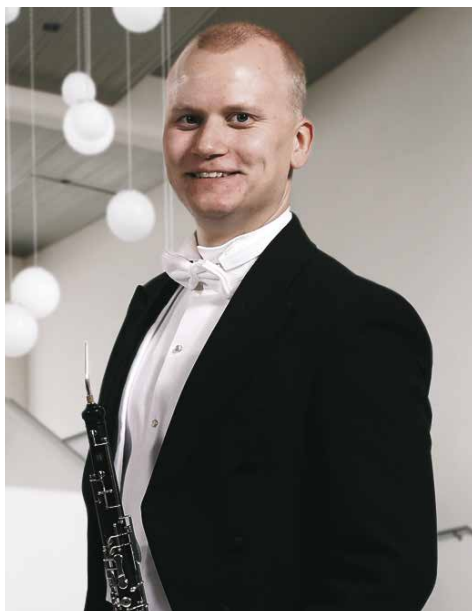
ANTTI TURTIAINEN